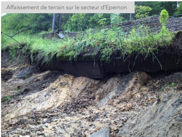
Affaissement de terrain sur le secteur d'Épernon

Sur la ligne TER Paris-Chartres-Le Mans, déjà touchée par l'incident de Meudon, on déplore également un affaissement de talus très conséquent qui nécessite le passage des circulations sur une seule voie, pénalisant très fortement le trafic.